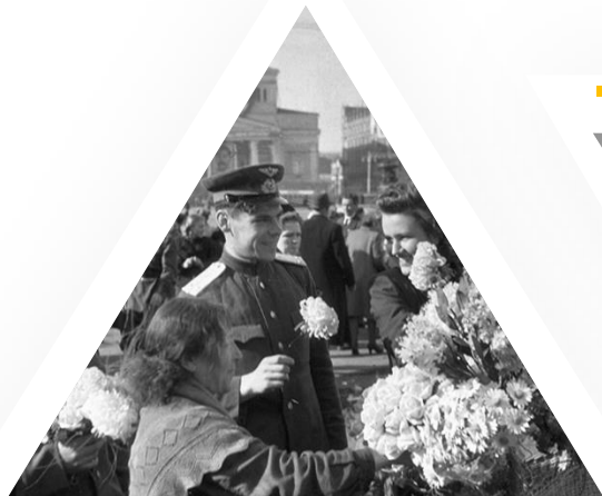
Цветы памяти Парады на Дальнем Востоке